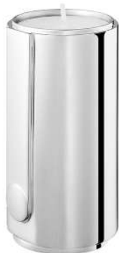
bougeoir H 8,7 cm