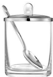
confiturier Ø 7,5 cm - H 11,2 cm