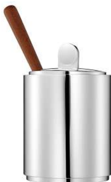
moutardier Ø 6 cm - H 9,3 cm