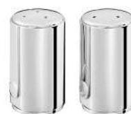
salière et poivrière Ø 2,5 cm - H 4,8 cm