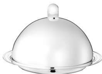
beurrier Ø 12,7 cm - H 7,9 cm