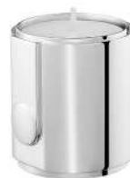
votive H 5,2 cm