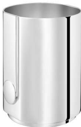
vase Ø 9,1 cm - H 12 cm