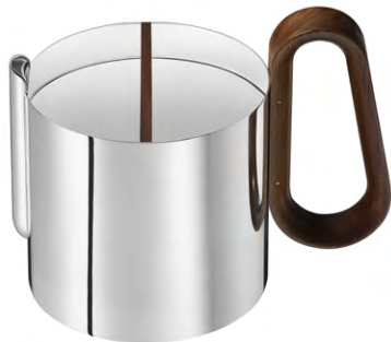
théière 70 cl - Ø 17,8 cm - H. 14,8 cm

LAITON ARGENTÉ, NOYER AMÉRICAIN ET VERRE ▲ SILVER PLATED BRASS, WALNUT AND GLASS