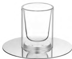
tasse à espresso 7 cl - Ø 11,9 cm - H. 9,3 cm

LAITON ARGENTÉ, NOYER AMÉRICAIN ET VERRE ▲ SILVER PLATED BRASS, WALNUT AND GLASS