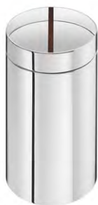
boîte à thé 80 gr - Ø 7,5 cm - H. 13,2 cm