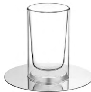
tasse à infusions 23 cl - Ø 14,7 cm - H. 13,8 cm

infusion cup 7.8 fl oz - Ø 5.8 in - H. 5.5 in