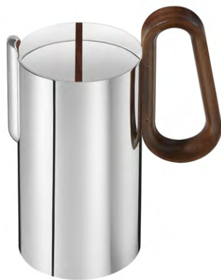
cafetière 80 cl - Ø 15,5 cm - H. 20,4 cm

coffee pot 27 fl oz - Ø 6.1 in - H. 8 in