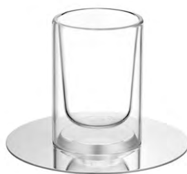
tasse à thé 15 cl - Ø 13,3 cm - H. 11,3 cm