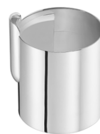
crémier 12 cl - Ø 6,5 cm - H. 8 cm