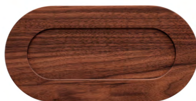
plateau PM 15 cm x 30 cm x H. 2 cm