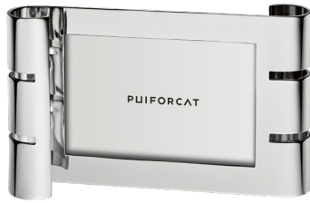
cadre photo horizontal petit modèle horizontal small picture frame