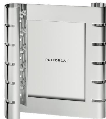
cadre photo vertical grand modèle vertical large picture frame