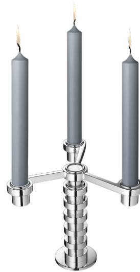
candélabre trois lumières candelabra three lights