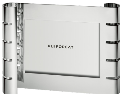
cadre photo horizontal grand modèle horizontal large picture frame

L. 29,5 x H. 22,5 cm L. 11.6 x H. 8.9 in