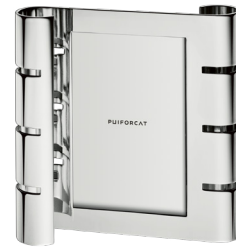
cadre photo vertical petit modèle vertical small picture frame