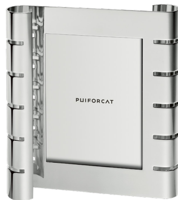
cadre photo vertical grand modèle vertical large picture frame